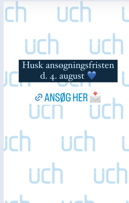
Instagram story format. Brug af online farver i tekstfelterne.

Hele ansigtet skal være synligt over tekstboksen.