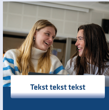
Instagram takeover skabelon